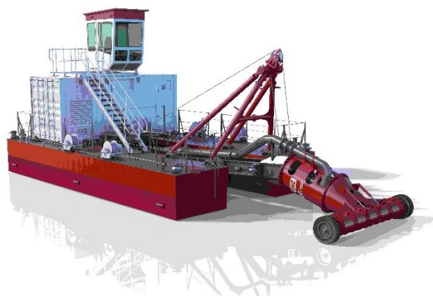
OTTer® 250 zuiger met het wormwiel en ladder in opwaartse positie