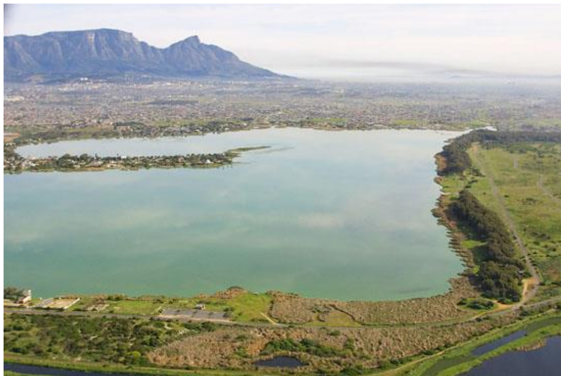
Zeekoevlei in Kaapstad, Zuid-Afrika